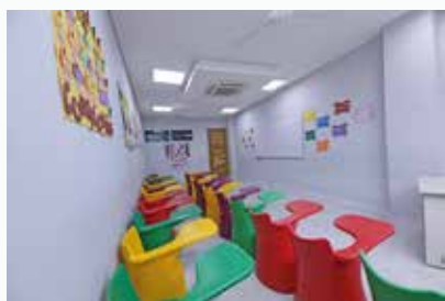
SALONES BÁSICA PRIMARIA

Un modelo pedagógico que combina: Ciencia, Tecnología y Humanismo , en una moderna infraestructura con todos los espacios necesarios para el aprendizaje, entrenamiento y recreación