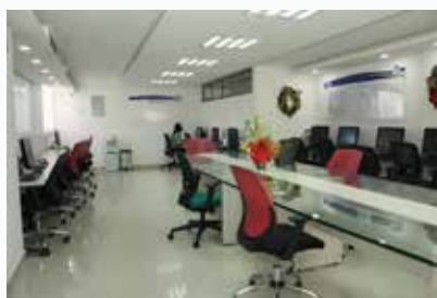
SALAS DE PROFERORES