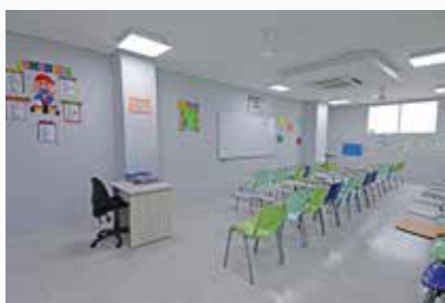
SALONES CON AIRE ACONDICIONADO